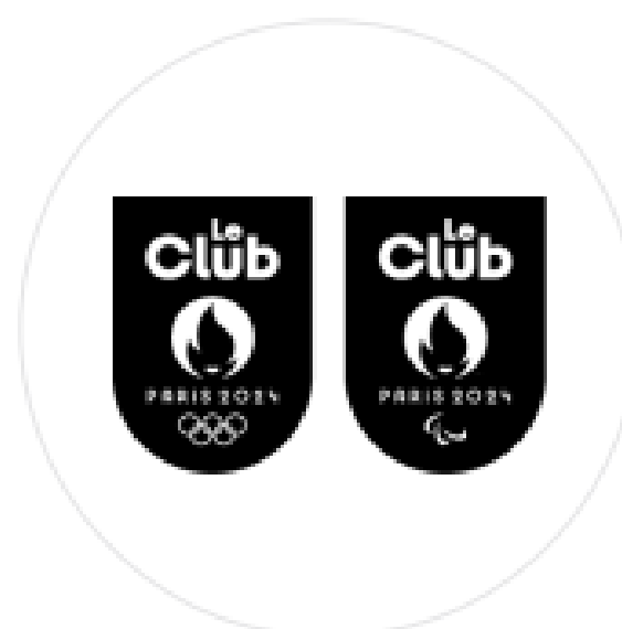
Le Club Paris 2024