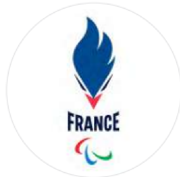
Logotype de l'Équipe de France Paralympique