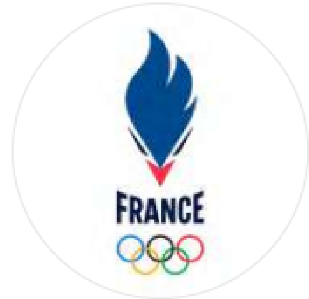
Logotype de l'Équipe de France Olympique