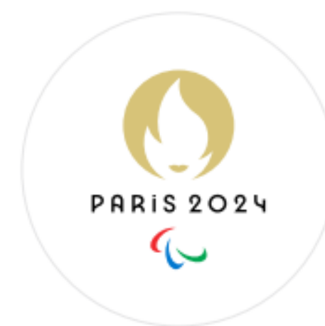
Emblème paralympique de Paris 2024