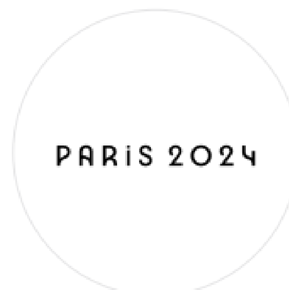
Signature des Jeux Paris 2024