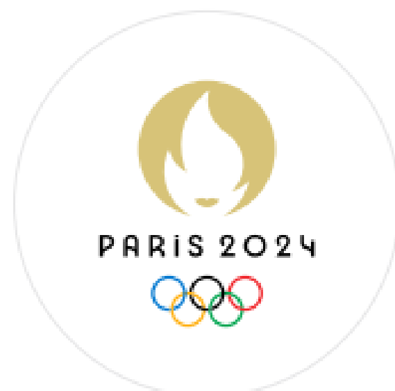
Emblème olympique de Paris 2024