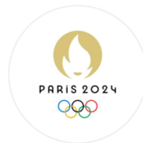
Emblème olympique de Paris 2024