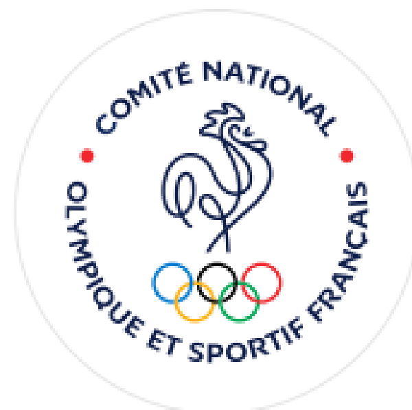
Logotype du Comité National Olympique et Sportif Français - CNOSF