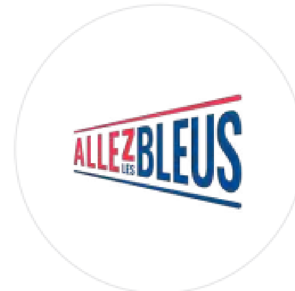
Allez les Bleus