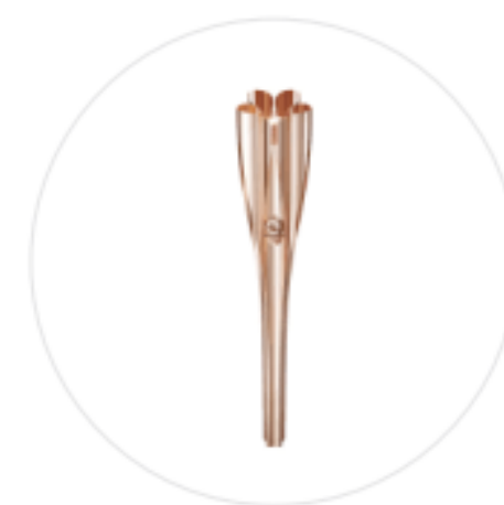
Flamme et torche olympique et paralympique