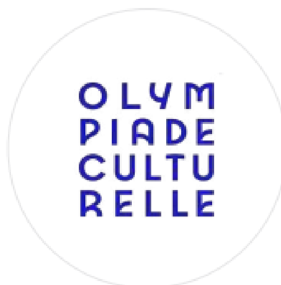
L'Olympiade Culturelle Paris 2024

Ces propriétés olympiques et paralympiques sont protégées par des droits de propriété intellectuelle, notamment en matière de parasitisme, ou encore de contrefaçon.