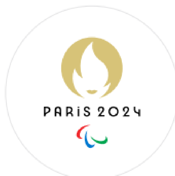
Emblème paralympique de Paris 2024