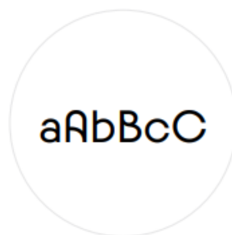
Typographie - Paris 2024