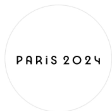
Signature (Ville et millésime) Paris 2024